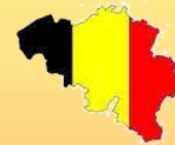
TABLE RONDE BELGIQUE - SUISSE